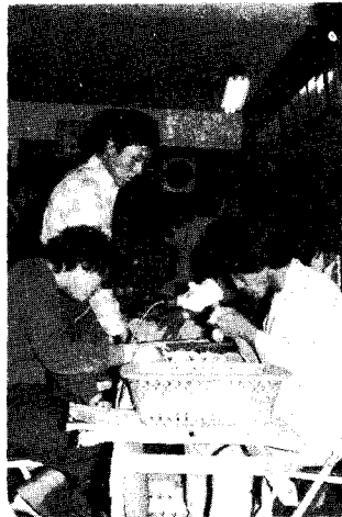
△ 감별에 여념이 없는 감별사 (고등 4명, 감중 21명의 감별사가 새로 탄생했다.)

경진대회는 본회가 감별분과 위원회와 함께 매년 한번씩 갖는 큰 행사로서 올해는 새로 우승기를 만들어 수여했고 입상자에게는 대형 은컵과 상패 그리고 부상으로 각각 시계 하나씩을 전