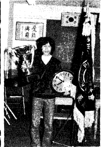
△ 경진대회에서 영예의 우승을 차지한 여인재 감별사