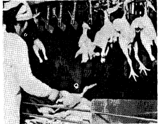
△ 닭고기의 포장은 가족수와 관계가 있어 판매량에 영향을 미친다