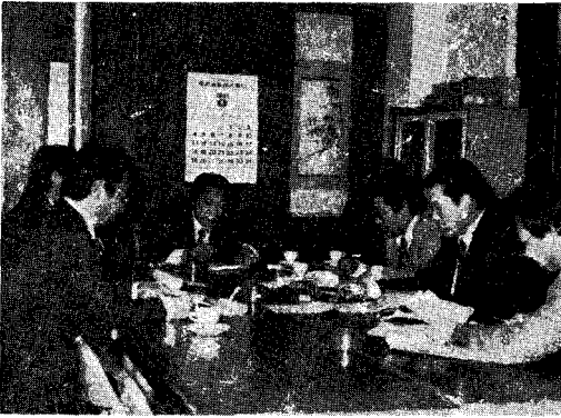
△ 회장단 회의

본회는 1월 9일 본회 회의실에서 신임 회장단 회의를 개최하고 본회 업무 전반에 대한 의견을 교환했다 이날 회의에서는 본회 집행부로 부터 본회업무의 전반적인 현황과 업무추진상황, 문제점 등을 상세히 보고 받고 주로 앞으로의 협회운영 개선방안에 대하여 집중적으로 논의했다.