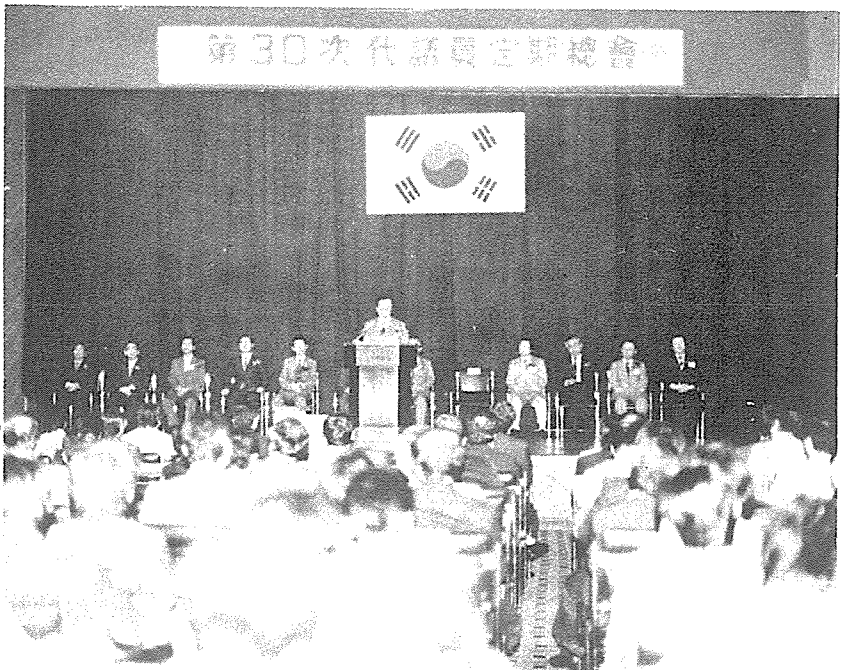
第30次 代議員 總會 開會式 光景