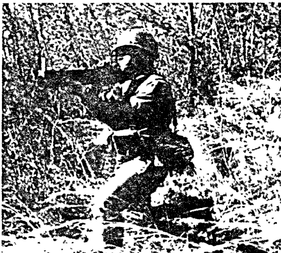
LAW (M72 로켓 발사기)의 사격자세

對裝甲戰鬪陣地를 선정하는 基準에는 엄폐, 차폐, 割當된 戰鬪區域의 관측, 相互支援, 上部 엄폐, 충분한 높이와 後爆風이 빠지는 구멍이 반드시 포함되어야 한다. 上部엄폐는 射手나 組員이 敵의 間接射擊에 극히 취약하기 때문에 중