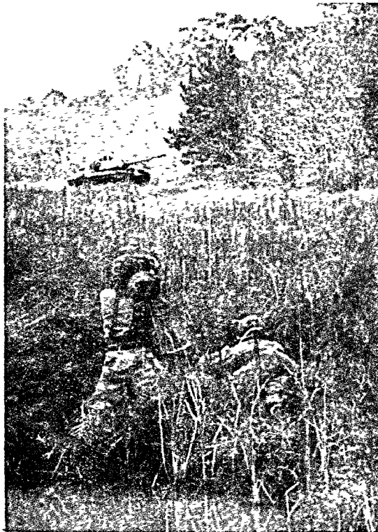
Dragon으로 戰車를 攻擊하고 있다.

兵士가 基礎訓練이 잘 되어있어야 한다. 그는 對裝甲武器의 능력과 夜間에 무엇이 進行되고 있는가를 알아야 한다. 敵裝甲車輛과 3,000m 距離에서 交戰하려면 射手는 3,000m 보다 더 먼 곳에서 目標을 잡아야 한다.