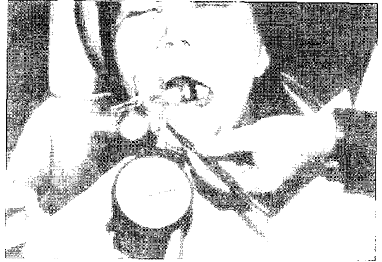
그림 3. 환자구강내에서 동요도를 측정하는 장면