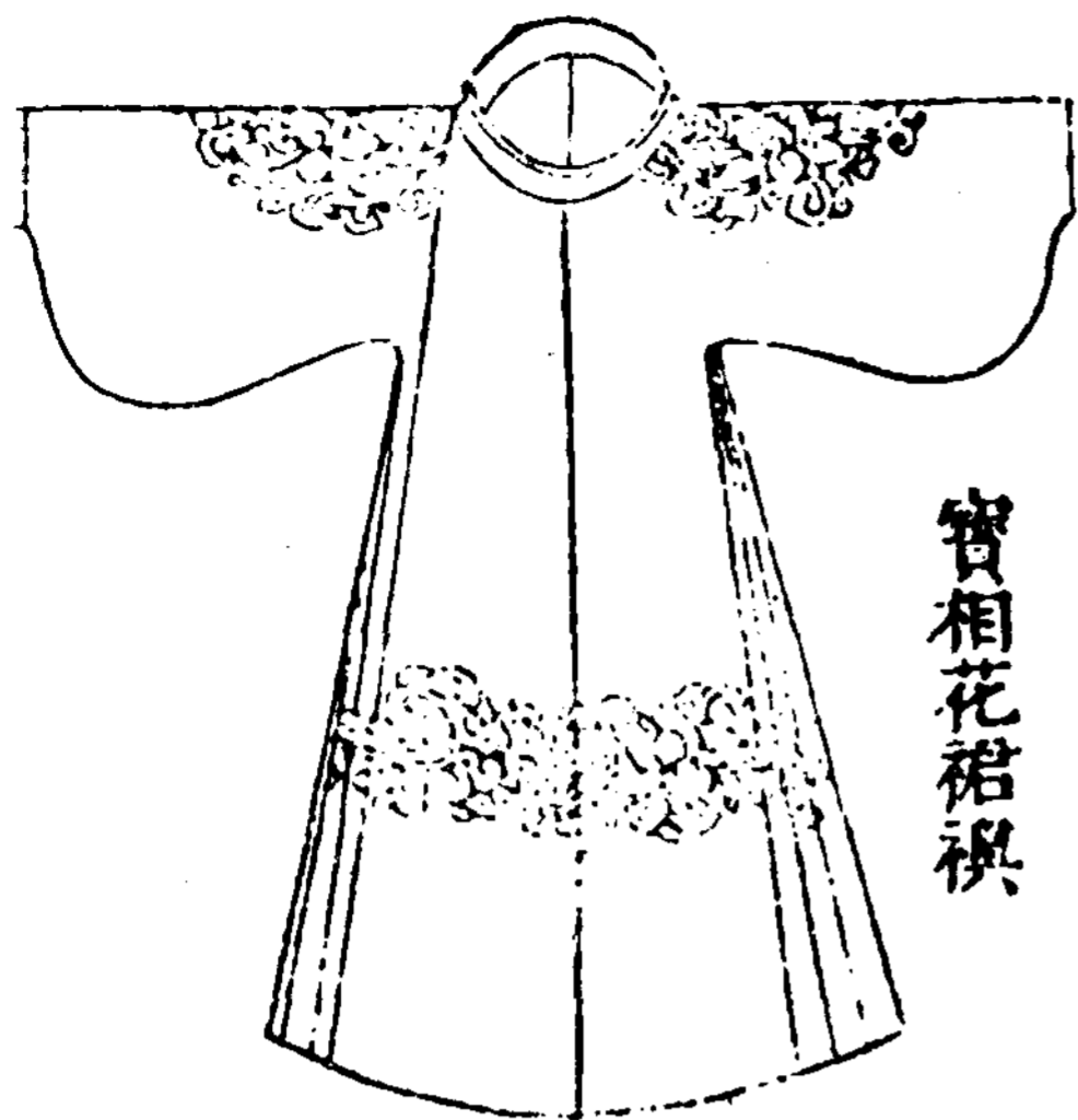
〔그림 5〕 寶相花衣(『三才圖會』, p.1593)

「立角」에 갖추는 옷인데, 服色은 「紫」와 「緋」이며, 「假銀帶」를 着用하되, 「緋寶祥花衣」의 경우는 「武弁冠」에 銅鍍金帶를 한다.