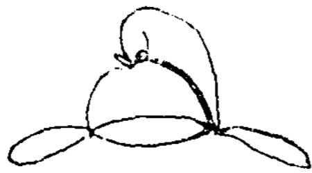
〔그림 2〕 紗烏帽 〔三才圖會〕, p.1535)