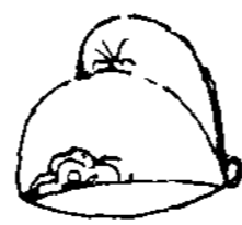
〔그림 3〕 〔三才圖會〕, p.1542)