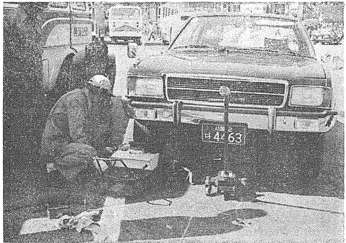
[타이어 點檢을 하고 있는 光景]

⑤ 觀光버스도 高速버스와 같이 많은 人命과 直接的인 關係가 있으므로 最少限 高速버스 정도 的 整備는 필히 하여야 한다.