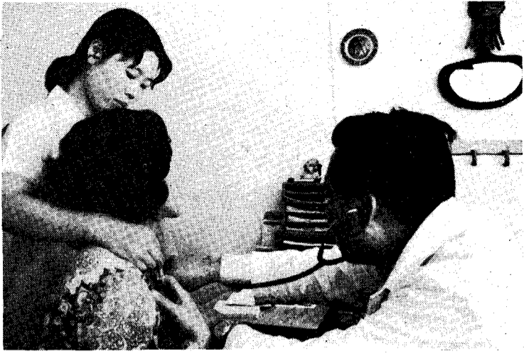
성인병 예방 협회보에 실린 사진은 여성들이 건강을 위해 노력하는 모습을 보여줍니다. 이는 현대 사회에서 여성들이 직면하는 다양한 건강 문제를 예방하고 관리하는 데 중요한 역할을 합니다.

새로운 時代의 醫學으로서 成人病問題는 그 比重이 대단히 크며, 成人病中에서도 女性에 있어서는 更年期障害은 빼놓을수 없는 것이다. 특히 이에 대한 治療法의 選定은 現代婦人科醫로서의 臨床 技術의 바로미터가 된다고 한다. 最近의 更年期障害 특히 그의 治療에 대한 研究경향을 살펴보면 本症의 內分泌面을 중요시하는 경우에서는 호르몬療法을, 그리고 本症患者에서 불수있는 神經精神症狀에 특히 重點을 두는 경우에는 각종 神經安定劑요법을 力說하고 있다. 그러나 어느쪽이 더욱 効果的이며 우선 무엇부터 할 것인가 당설이게 된다. 更年期障害는 그 概念도 아직 막연하고 그 發生機轉도 대단히 複雜함으로 호르몬療法이나 기타 藥物療法도 또 精神安定劑의 投與도 필요하며 동시에 精神요법도 重要한 것이다 本症은 자칫하면 更年期障害라고 간단히 取扱하여 환자에게 內내를 主張하는 경우도 있고 患者도 역시 更年期이니까하고 자기마음대로 自己의 症狀를 풀이하는 경우도 있다. 更年期의 婦人에는 月經異常, 閉經, 更年期出血, 老人性腔炎, 骨疎鬆症, 疲勞感등의 內分泌障害가 直接原因이 되는 증상, 肥滿, 更年期糖尿等의 代謝異常이 원인이 되는 症狀 自律神經中樞障害症狀, 心因性症狀등의 不定愁訴症狀, 그리고 更年期精神病등의 증상이 나타난다. 그러나 大部分의 症狀, 또는 疾病에는 고유의 名稱이 붙어 있음으로 更年期에 나타나는 不定愁訴症狀에만 특정한 名稱이 없다. 따라서 「更年期에 나타나는 不定愁訴를 주로 하는 症候群을 更年期障害」라고 고도 할수있다. 이와같이 更年期障害의 定義도 사람에 따라서 다르므로 治療法도 일정하지 않은것이 當然하다.