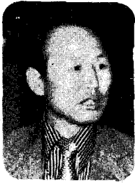
〈서 무 권〉