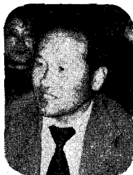
〈원 승 제〉

문제가 심각하게 될 염려가 있으니 당국에서 우선 비축이라도 하여 주기를 바랍니다.