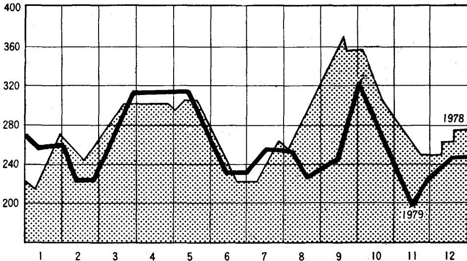
대란가격 월별 추세(서울지역 1978~79년) (단위: 원/10개)