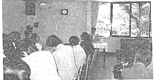
〈 강릉 공군회관에서 열린 강원도치과의사회 보수교육 광경 〉