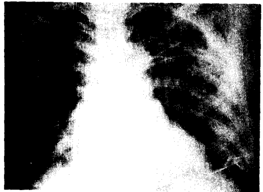
Fig. 6. 박 ○ 윤의 흉부단순촬영소견.

안면부, 흉부전면의 자색변화 및 심한 피하기종이 복부까지 파급되어 있다.