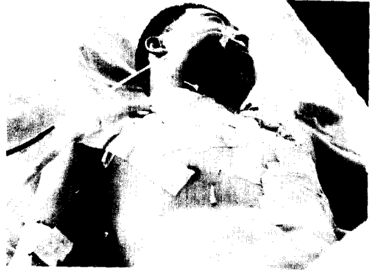
Fig. 5. 박 ○ 윤의 사고직후 나타난 외상성 가사.

본 환자의 응급실 도착당시 Hb : 11.9gm%, Hct : 35%였으며 WBC : 16000/mm 3 이었고 Na : 132mEq/L, K : 5.0 mmol/L, Cl : 16mEq/L이었다. 소변검사소견상 다량의 적혈구가 배출되어 혈액색깔이었다.