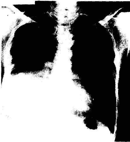
Fig. 4. 이 ○ 조의 흉부단순촬영소견.