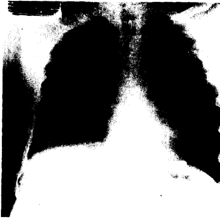
Fig. 3. 김 ○ 중의 흉부단순촬영소견.