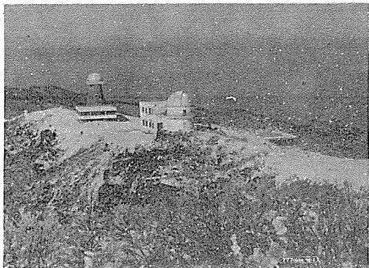
<사진: 小白山 天體觀測所 光景>

이와같이 國立天文臺는 수 년간의 準備期間을 거쳐 이제 本格的인 觀測과 研究단계로 접어들고 있다.