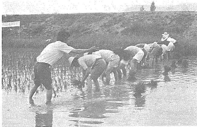
모내기에 여념없는 직원일동

서울시지부 직원 일동은 지난 6월 15일 10:00~17:00 까지 경기도 벽제군 고양리 두표동 소재 논 1,000평을 모내기 지원 하였다. 이날 동원된 직원은 비상근무자를 제외한 20명이 참석 서투른 솜씨지만 땀흘려 보람에 왔다.