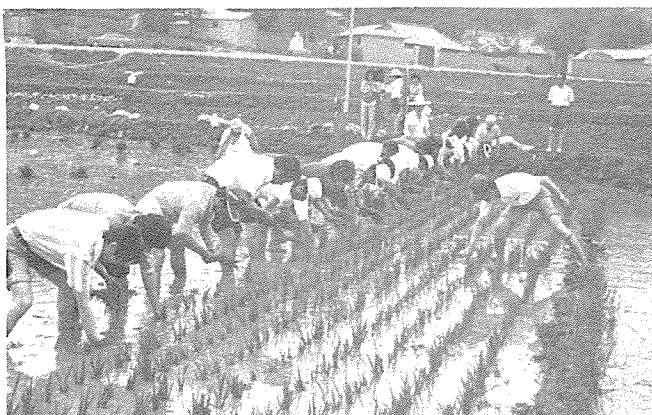
회원 및 직원의 일사불란한 솜씨

6월 14일 10:00~15:00 지원농가 대전시 중구 산성동 23번지 최병섭의 소유답 800평 참석인원 60명.