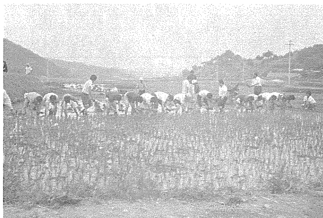
1,400평을 누비는 회원들의 땀방울

지난 6월15일 전남지부 건축사 회원60명은 일손이 부족한 농촌 모내기작전에 전원참가 박노을씨 소유 1,400평을 5시간에 걸쳐 끝내므로써 농촌의 시름을 덜었다.