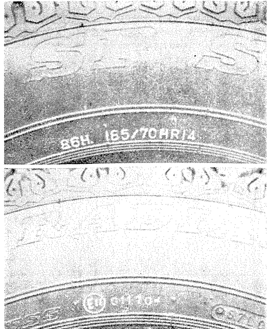
[ECE No 30의 Labeling 實例]

단, 이 規則이 施行되기 前에 나온 타이어에 對해 서는 別途로 정한 값으로 생각한다.