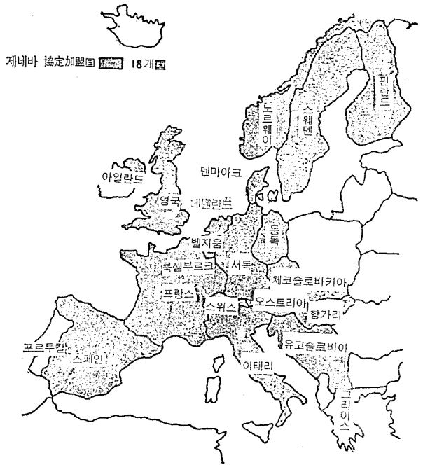
〔그림 2〕 제네바 協定 加盟國