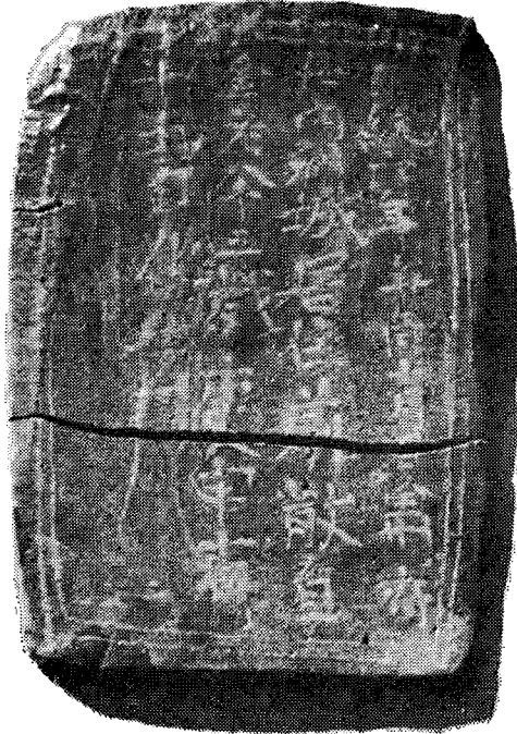
寫眞 1. 正統六年銘墓誌