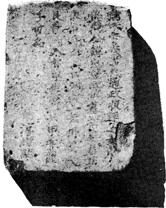
寫眞 2. 全義李氏墓誌

孺人全義李氏通政順達之女東 隱趙公諱完璧配也墓在府○墓 後右 向上曲池穴一云樹壁穴 長龍卯入甲坐原一云甲卯龍 子哲禹 動淳謹誌 丁卯九月日六世孫