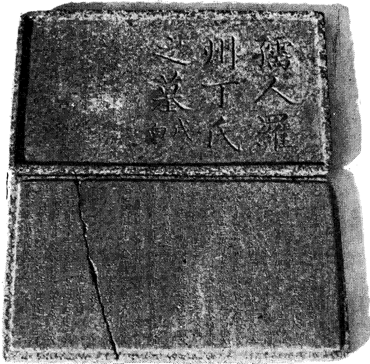
寫眞 3. 羅州丁氏墓誌