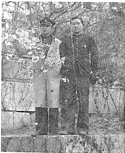
京齒專在學時節 「모자를 쓰지 않는분」