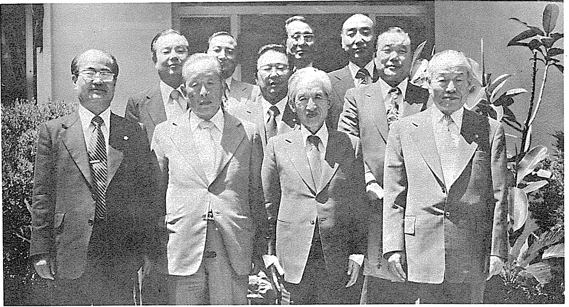
서울대학교 總同窓會 會長團과의 記念撮影