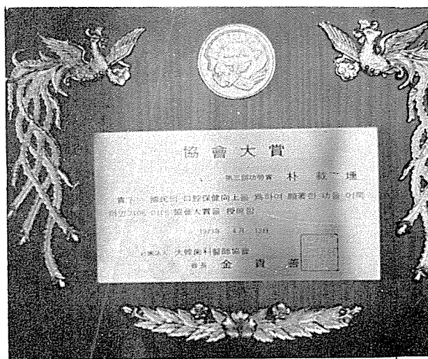
1973년 4월 大韓齒科醫師協會에서는 協會大賞인 功勞牌를 授與한 바 있다.

최근 齒科技工所의 施設과 規模를 대폭 擴張하여 아래 장소로 移轉하였기 인사드리며 有能한 技士를 補強, 보다 훌륭한 材料를 嚴選하여 堅牢한 技工物製作을 위해 精誠을 다할 것을 約束드립니다.