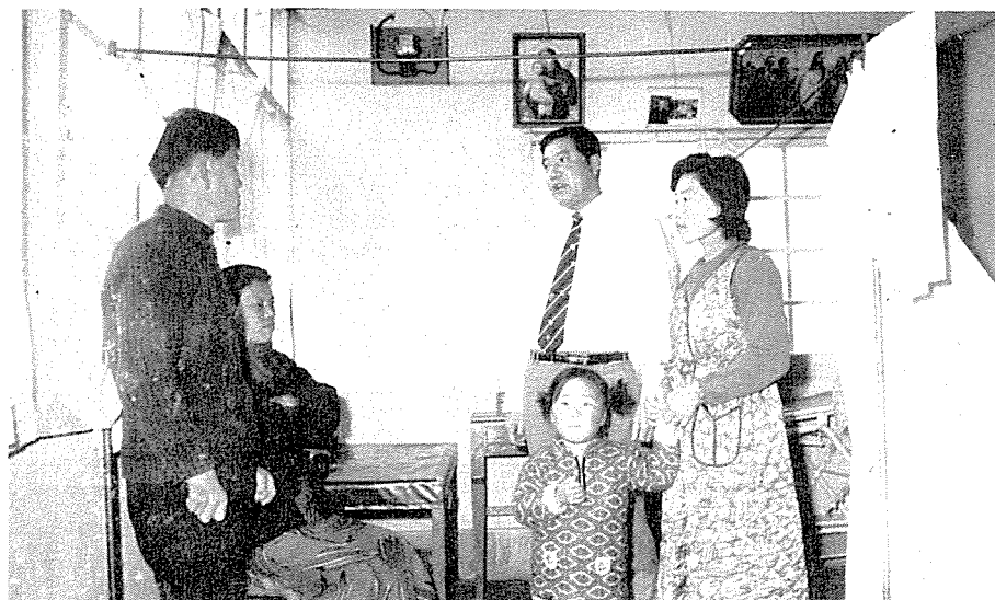
倭館 삼청동 나환자촌을 찾아 지난週 施療한바 있는 患者에게 口腔狀態를 묻고 있다.