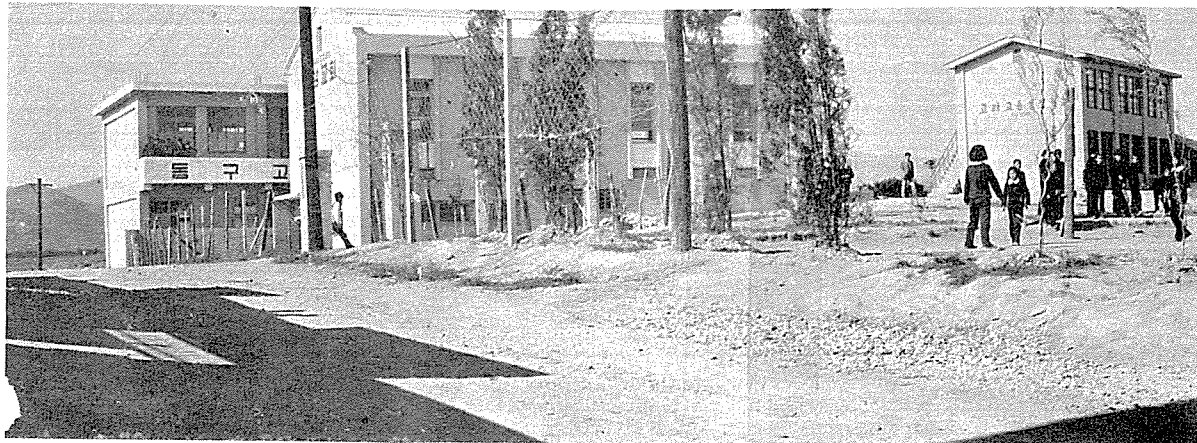
<卞鍾秀 博士가 設立한 東丘高等公民學校 周邊,