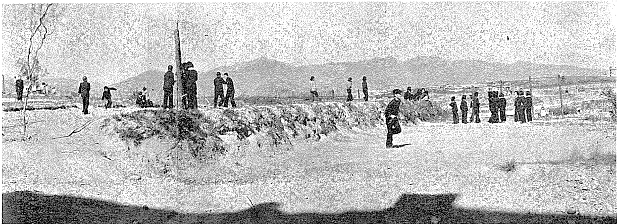
이 學校가 지금은 大邱의 名門校로 登場했다