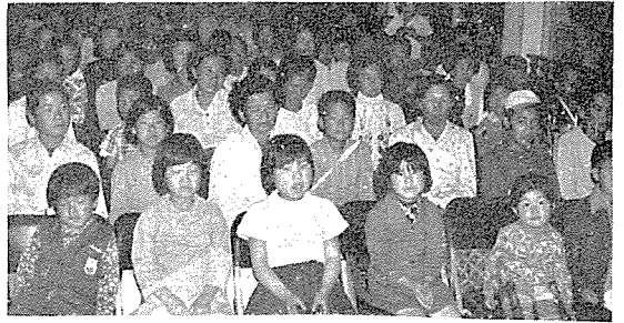
大邱家庭福祉會에서 肅고 있는 사람들을 對象으로 한 月例教育集會 光景