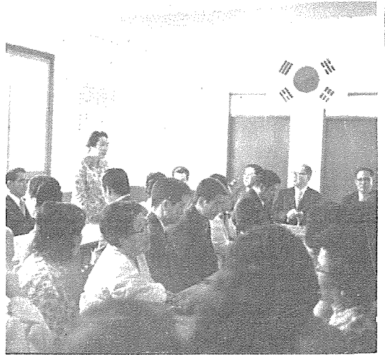
보사부 부녀 아동국장께서 은혜원 낙성식장에서 격려를 하고있다.

齒科醫學界의 자랑, 意志의 齒科人 朴三烈先生님 앞 날에는 오로지 榮光만이 있을 것이다.