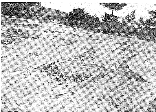
사진 : 발효전분박사료 해결을 위해 전분박 발효 사료를 적정량 배합, 건조시킴으로써 영양적인 利點을 제시했다.

⑤ 子豚증에는 무항문등 기형돈이 발생하고 있어 근친번식을 억제하고 交配방법을 개량했으며, ⑥ 이 농장은 사료 해결을 위하여 전분박을 주로 이용하고 있었으나 발효전분박 사료해결을