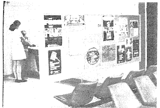
제 4 도 Dental Therapist들의 TBI 광경 및 그들이 만든 Melbourne의 치과 계몽용 포스터

국민학교 학동에 대한 처리가 제 1의 임무이며 이같은 진료는 철저하게 제한되어 있으며 칫파의사의 감독하에 이루어져야 한다.