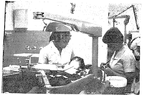
제 2 도 교정학교치과진료실의 Dental Therapist와 Adelaide