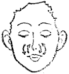
④ 코의 주위