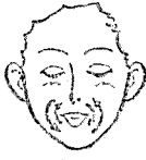
⑥ 입 주위