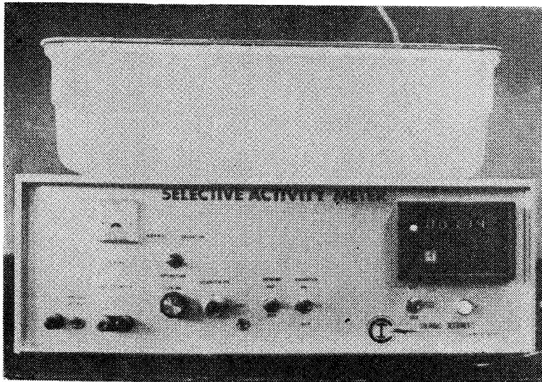
그 립 1.

Selective activity meter (Columbus Instrument Co.) 위에 가로 47 cm, 세로 25.5 cm, 높이 13 cm의 plastic 상자에 흰쥐를 5마리씩 넣어 실험하였다. 동작