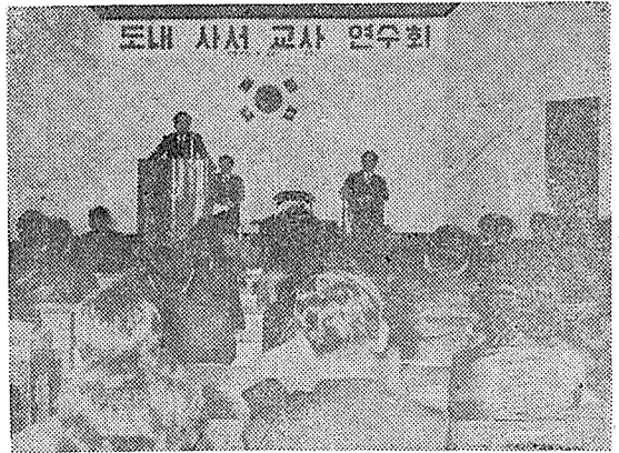
— 忠南 司書教師 研修會 光景 —