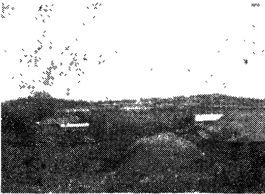
<멀리서 본 상원농장의 전경>

상원농장에서 경영특징을 설명함에 있어 우선 먼저 손 꼽을 수 있는 것이 앞서 말한 철저한 계수관리이고 그 다음으로 꼽을 수 있는 것이 바로 인력관리를 효율적으로 한다는 점이다.