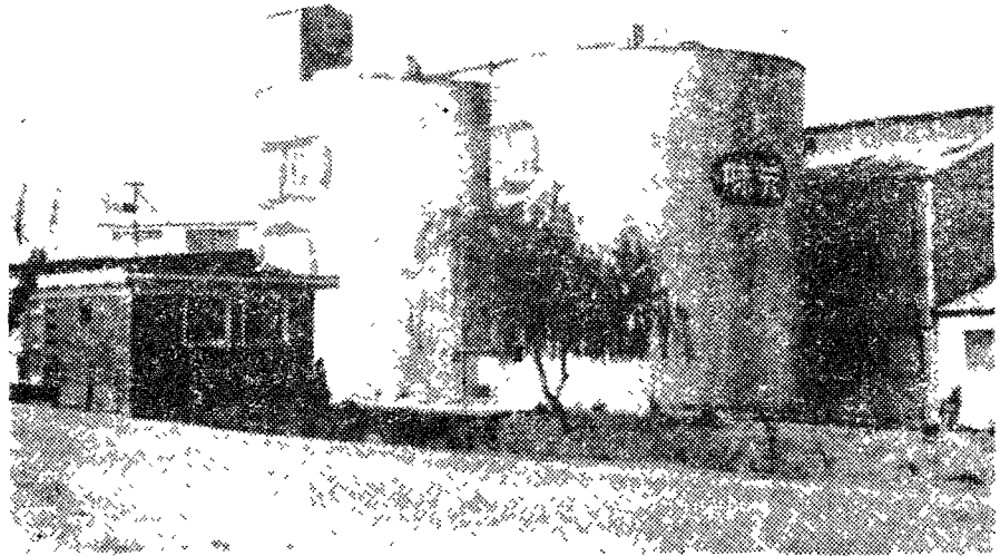
<「미원사료」 정문에 들어서면 깨끗하고 정교하게 우뚝 선 최신식 사이로가 제일먼저 눈에 들어온다>