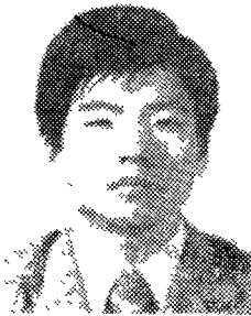
<이 총범 계장>

1. 축산업의 변천에 따라 양축가가 필요로 하는 제품은 계속 신속히 개발공급될 것이며 극심한 불경기를 극복하기위 해서라도 시장의 세분화를 들어 다각적인 신제품이 많이 출현 할 것이다. 앞으로 디테일 분야를 강화하여 완전 디테일맨을 투입 우수한 자사제품의 적극제인 P.R은 물론 양축가에게 기술적인 서서비스를 함으로써 판로를 개척 수요를 증대시켜 나가야 할 것이다.