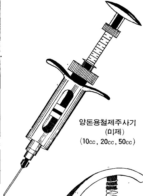
양돈용철제주사기 (미제) (10cc, 20cc, 50cc)