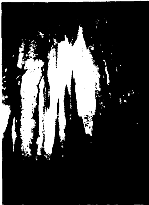
고씨굴의 종유석 경관