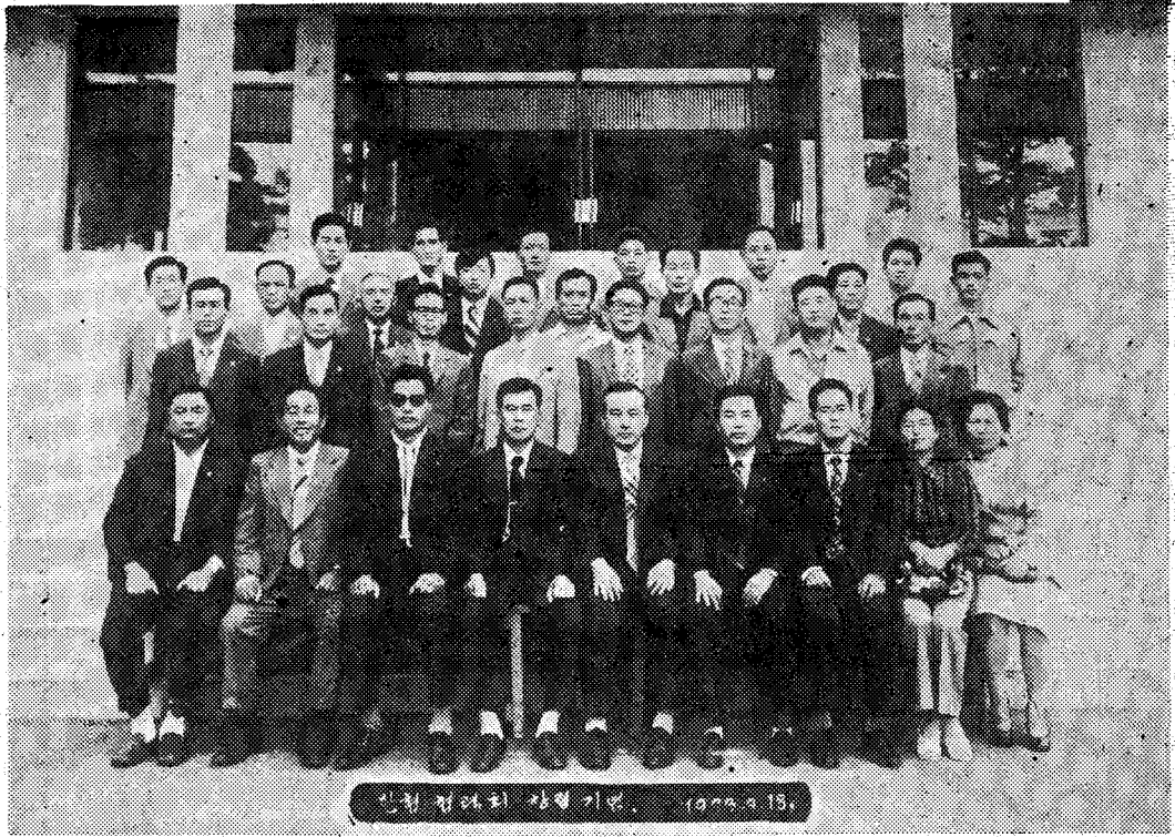
〈한협 협력회 창립시 회원일동 기념 촬영〉