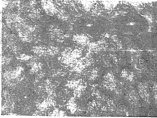
사진 3. 對照群에 있어서의 SH基反應 (×400)

없었다. 線條部細胞形質에서는 腺上皮細胞보다 若干濃染된 赤紫色을 呈染한 傾向이 있었으나, 亦是 全般的으로 單調로운 呈染反應이었고 또한 顆粒狀物質은 거이 認定하기 어려웠다.