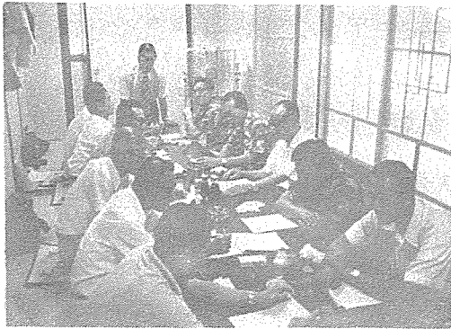
第三回 支部長 會議光景(浦項에서)

第3回 全国 支部長 會議가 慶北支部 浦項 分所에서 8. 13(월) 12:00시에 개최되었다. 會長이하 本協會 理事 및 各市道支部長이 참석한 가운데 本部 業務현황과 各市道支部의 업무보고에 이어서 토의사항에 들어갔다.