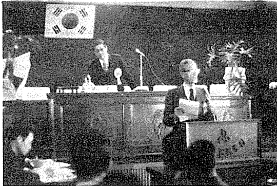
尹 監事の 監査報告