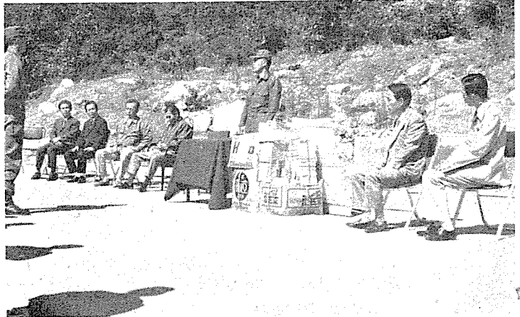
慰問次 訪問한 本協會 任職員에게 答禮하는 戰警隊長