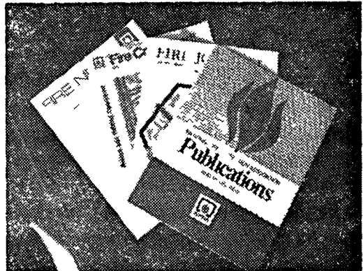
<消防基準集 및 各種 刊行物>

「NFPA」는 各種 教育資料를 또한 發刊하고 있다 現在 NFPA의 刊行物의 種類는 約 800種이나 되며 이들 資料는 每年 數百萬部씩이나 配付되고 있다