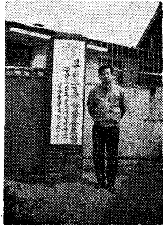
부친축협의 계란군납 실적