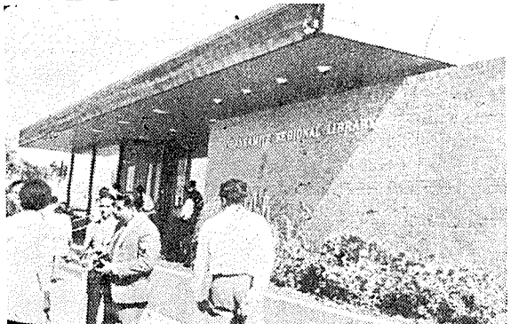
(빅토리아주 코랑가마이트지역 중앙도서관)