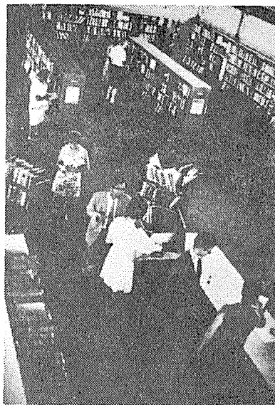
(West Perth시 공공도서관)