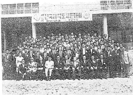
大學圖書館大會 記念撮影