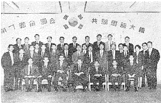
公共圖書館大會 記念撮影