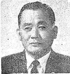
FAPA會議組織委員長 大韓藥師會長