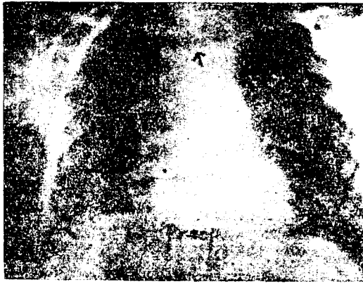
Fig. 1. P-A chest film showing widened superior mediastinum and pulmonary infiltrations. Arrows show fluid level in the dilated esophagus. Case 2.