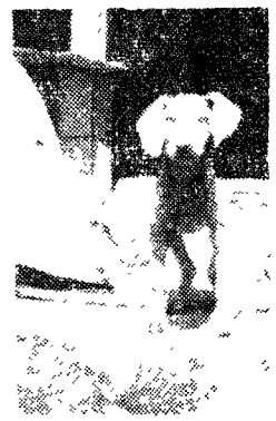
피부질환 기생충증과 구루병 (생후 60일 필자촬영) (생후 4개월 필자촬영)