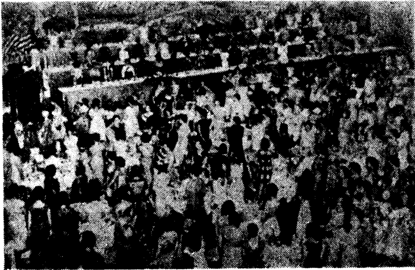
(사진은 제 9 회 국제가정학회 총회장광경)