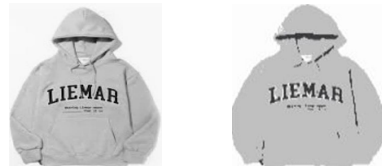
[그림 1] 실제 이미지 [그림 2] 결과 이미지

Color Clustering이란 K-Means 기반의 알고리즘으로, 이미지 내 색상의 개수를 k개로 감소시킨다. 이는 이미지를 그림처럼 변환시키고자 할 때 사용될 수 있다.