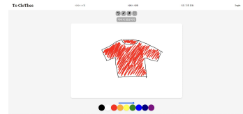
[그림5] 그림판 예시 이미지

HTML, CSS5를 이용해 디자인하고, JavaScript로 웹 상에서 기능하는 간단한 동작들을 구현했다. Canvas API의 내장함수를 이용해 그림판 기능을 구현했다. 사용자는 웹에서 제공된 그림판을 사용하여 옷을 직접 그리거나 이미지를 업로드한다. 그려진 이미지나 업로드된 이미지는 학습시킨 모델에 입력되어 사진과 유사한 이미지로 변환된다.