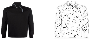
[그림3] 실제 이미지 [그림4] 결과 이미지

라인 스케치와 색상을 지정한 이미지를 결합해 최종적으로 입력 이미지를 생성했다. 색상을 지정한 이미지 위 라인 스케치에서 색상이 흰색이 아닌 부분을 매핑해 라인이 더욱 뚜렷하게 표현되도록 이미지를 결합해 사용했다.[2]