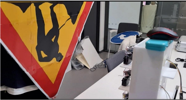
(그림 2) 역삼각형 측정.

(그림 2)와 (그림 3)을 통해 (그림 1)의 회로를 동작시켜 역삼각형 표지판을 인식하고 출력한 것을 확인할 수 있었다.