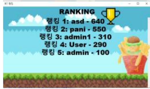
Fig. 4. 랭킹 화면

그림 3 게임 제한 시간은 1분으로 순서에 맞는 재료를 선택했을 때만 화면 좌측 아래에 재료가 쌓인다. 스택으로 재료가 쌓여 햄버거가 완성되면 100점의 점수를 얻을 수 있고, 잘못된 재료는 10점, 폭탄은 30점이 감점된다. 점수는 좌측 중앙에, 남은 시간은 우측 중앙에 출력한다. 만약 재료의 수가 너무 많아지면 가장 오래된 재료가 제거되도록 하고 제한 시간이 끝나면 해당 닉네임과 점수를 DB에 저장한다. 그림 4는 랭킹시스템을 구현한 화면이다.