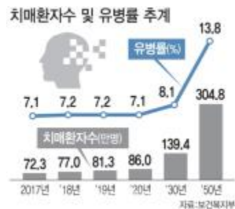
Fig. 1. 치매 환자 수 및 유병률 추계

노인성 치매란 다양한 원인으로 뇌 기능이 손상되면서 이전에 비해 인지능력이 지속적이고 전반적으로 저하되어 일상생활에 상당한 지장이 나타나고 있는 상태를 가리킨다[1.] 그림 1과 같이 고령화 사회로 진입된 만큼 치매 환자수 및 유병률 추계도 꾸준히 증가하고 있다[2]. 치매는 최대한 이른 시점에서 진단과 그에 맞는 적절한 개입이 중요한 질병이다[3]. 약물이나 게임을 통한 치료와 심혈관계 운동을 통한 인지기능 감퇴의 진행 속도 저하, 기억력 완화에 관심이 증가하는 추세이다. 관심이 높아지는 만큼 대뇌피질의 이상으로 생기는 기억장애와, 행동 양상을 인지하고 추상적인 사고를 할 수 있는 능력에 이상이 생기는 전두엽 수행능력 장애 완화 그리고 간단한 신체의 움직임에 집중하였다[4].