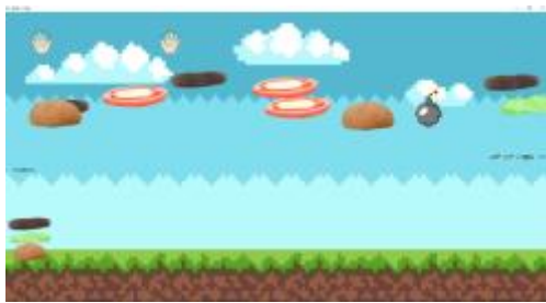
Fig. 3. 게임 실행 화면

그림 2의 화면에서 사용자의 닉네임을 입력하고, NEXT 버튼을 클릭하여 게임을 시작하면 그림 3 게임 화면이 나타난다.