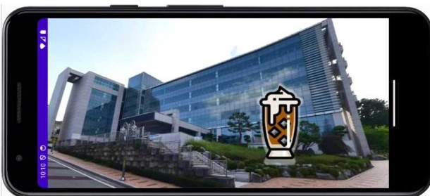
그림 2. AR 주변안내 서비스

주변 정보 안내 기능은 안드로이드 앱 개발 도구인 안드로이드 스튜디오와 AR CORE를 연결하여 구현했다. 사용자는 자동 주문 기능을 통해 방문하고자 하는 상점의 메뉴를 선택한다. 결제가 완료되면 화면에 상점이 위치한 사진이 뜬다. 사용자는 화살표 버튼을 클릭하여 해당 상점이 위치한 공간 측면, 전면 등의 주변 정보를 파악한다.