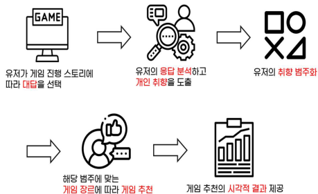
(그림 1) 게임 추천 프로세스

<그림 1>은 게임 추천 프로세스를 시각화한 것이다. Solar2d 게임 엔진을 활용하여 스토리 게임 형태로 게임 추천 프로세스를 구현했다. 게임 선호도 정보는 게임 선택의 기준이 되는 세 가지 요소에 대한 질문에 답하는 방식으로 수집된다. [2] 이러한 응답은 규칙 기반 필터링을 통해 분류된다. 이 분류에 따라 사용자에게 맞는 게임을 추천한다.